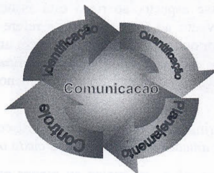
Figura 1: Ciclo do gerenciamento de risco

Em cada uma dessas etapas devem ser feitas a documentação e comunicação das informações obtidas ou decisões tomadas.